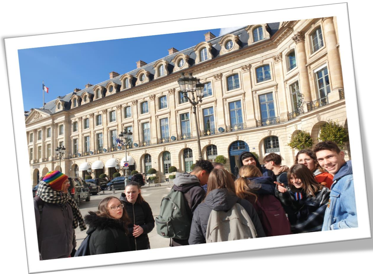
Devant le Ritz