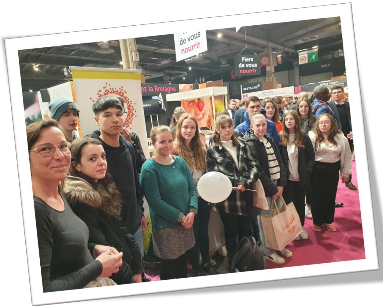
Avec la députée Mathilde Hignet au salon de l'Agriculture. Mme Hignet est déjà venue dans la classe parler de son rôle en circonscription et à l'Assemblée.