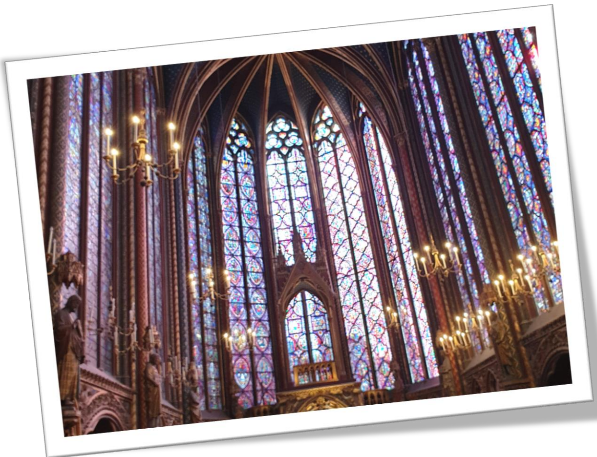
A la Sainte-Chapelle, sur l'île de la Cité