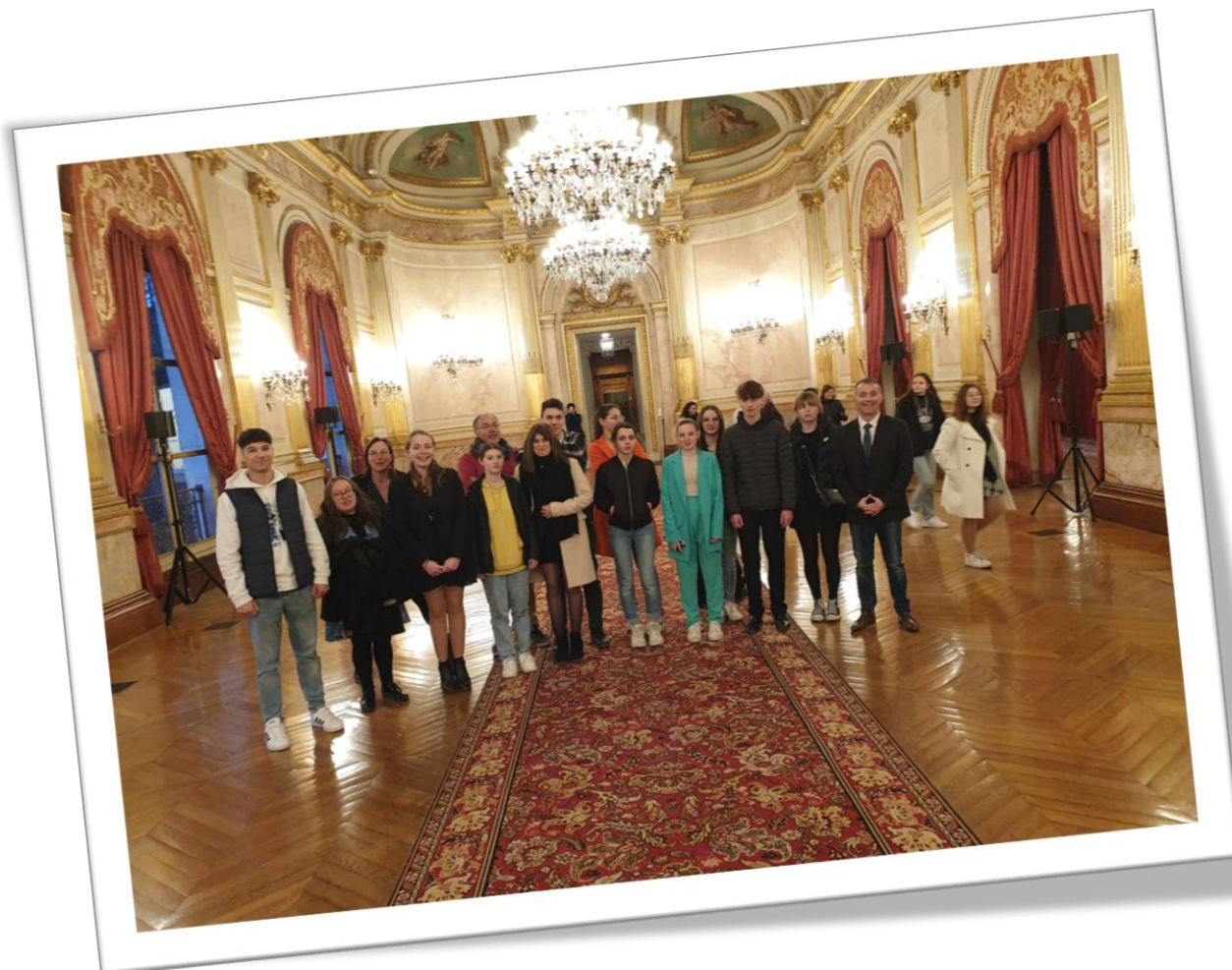
Au Palais Bourbon lors de la visite guidée de l'Assemblée Nationale.