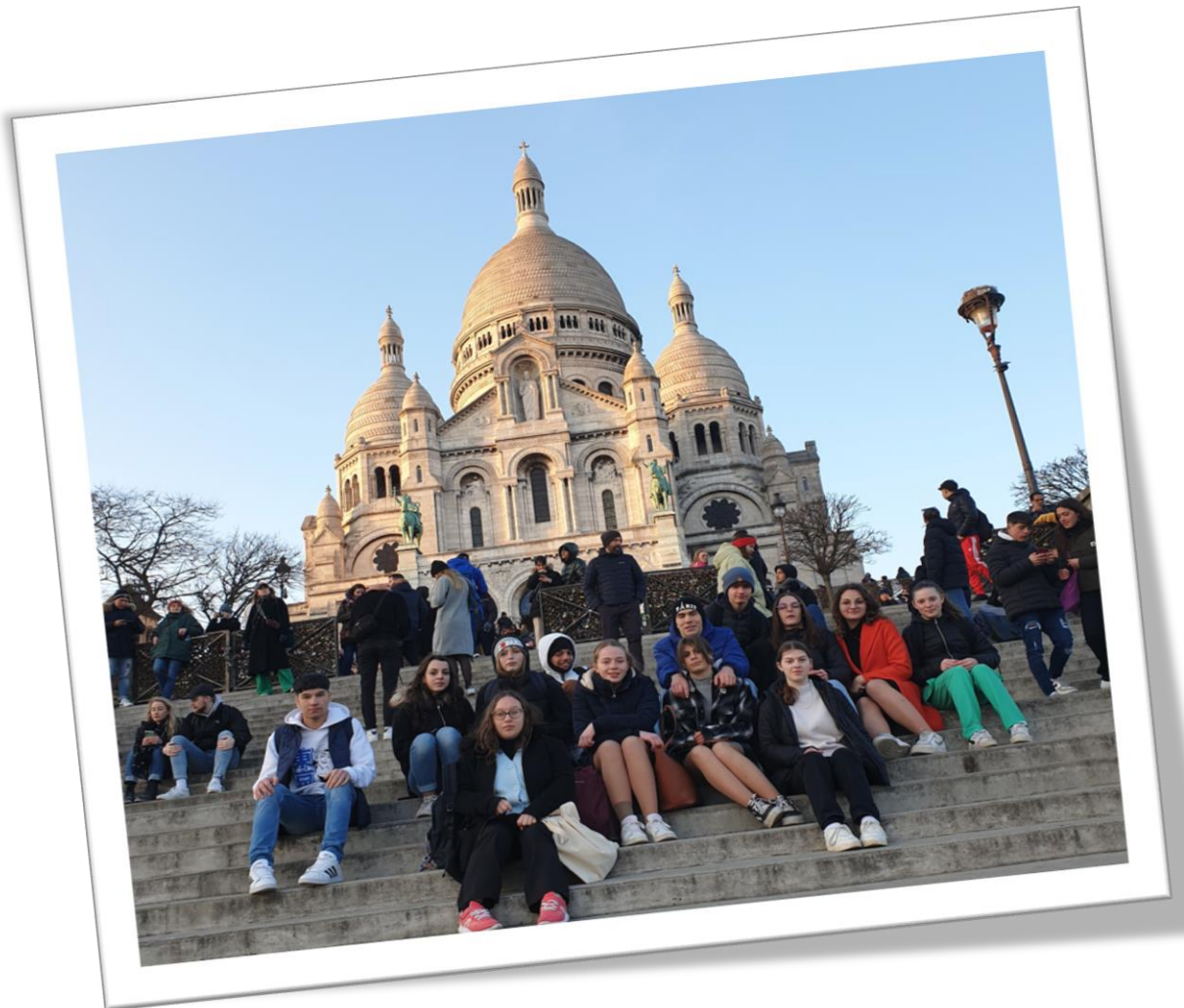
Devant la basilique du Sacré-Coeur lors de la balade dans le quartier de Montmartre.