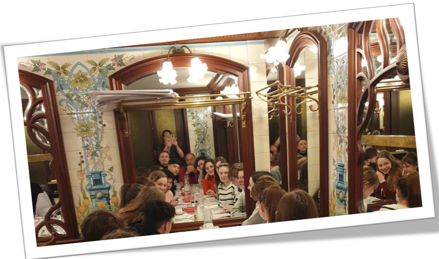
Au Bouillon Chartier pour étudier des professionnels à l'œuvre : rapides et efficaces !