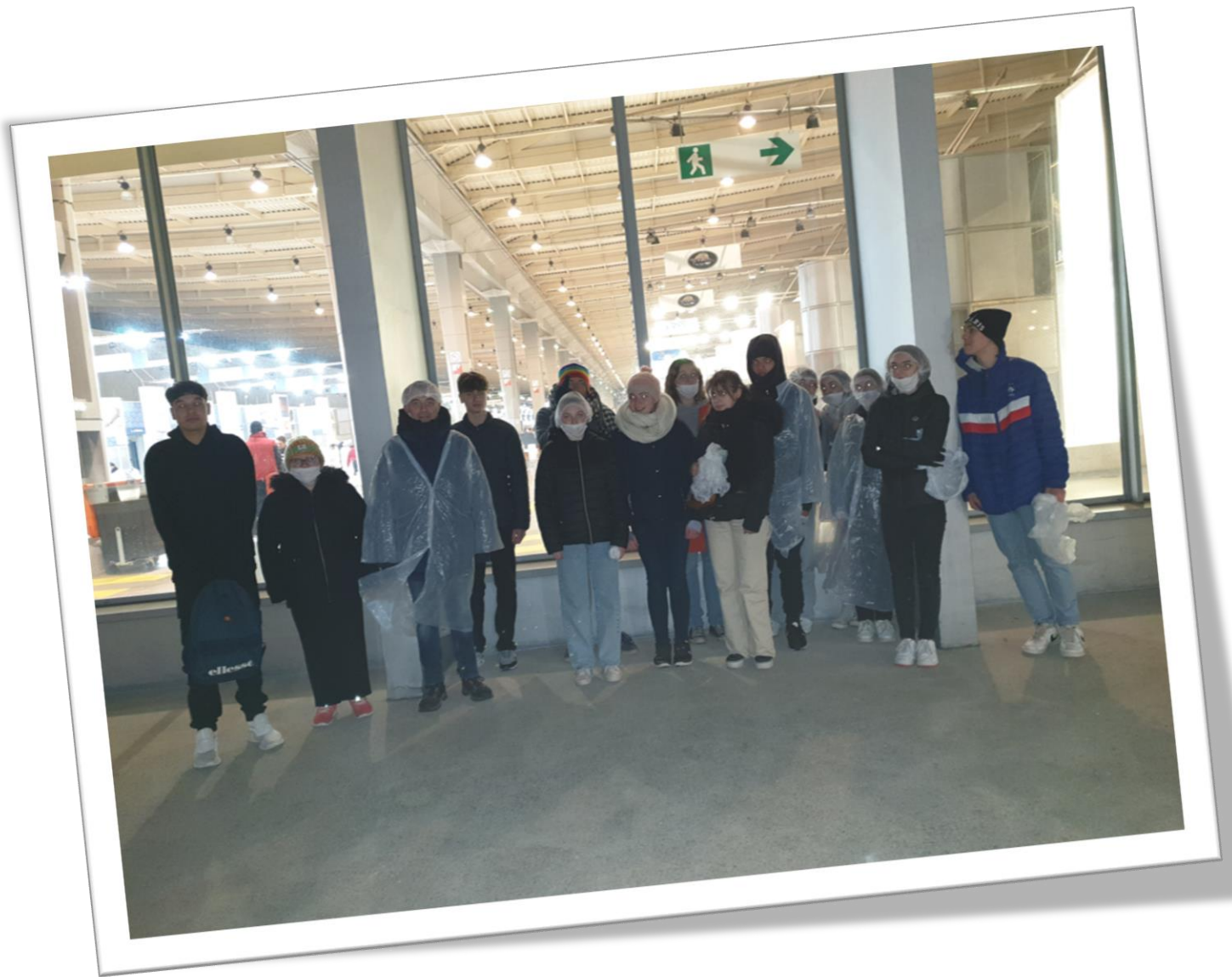
Au Marché de Rungis dans la nuit du jeudi au vendredi...