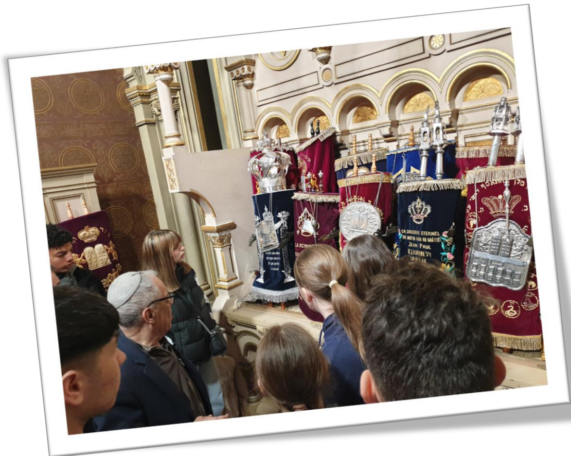
Dans la Grande Synagogue de Paris