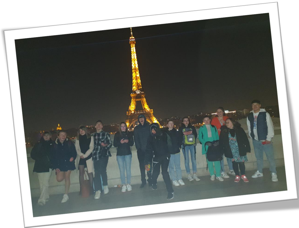
Devant la Tour Eiffel illuminée.