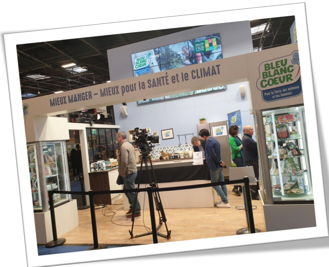
Au Salon de l'Agriculture, dont la plupart des entrées ont été offertes par Bleu Blanc Coeur