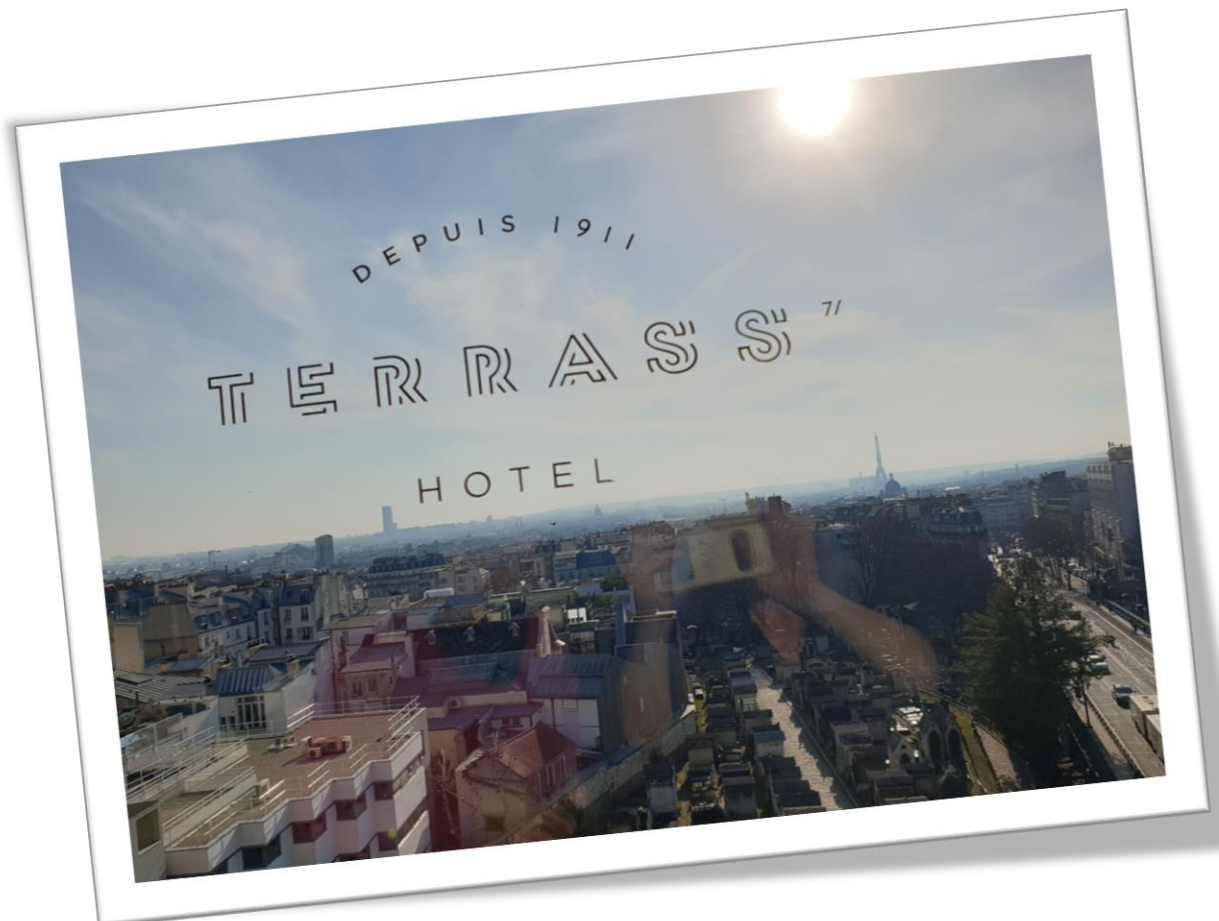
Vue du Terrass' Hôtel pour la visite professionnelle d'un établissement 4 étoiles.