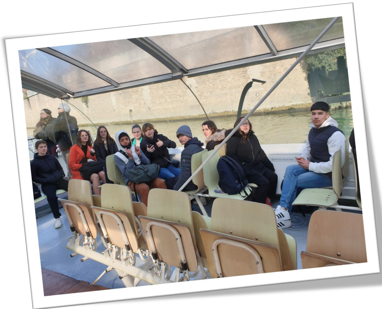
Dans le batobus pour admirer les monuments le long de la Seine