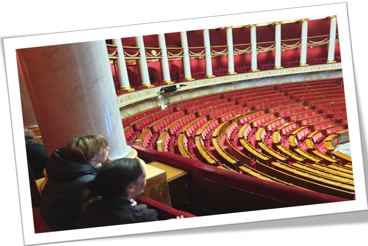
Dans l'hémicycle de l'Assemblée Nationale, dont nous avons étudié l'émergence lors de la Révolution Française.