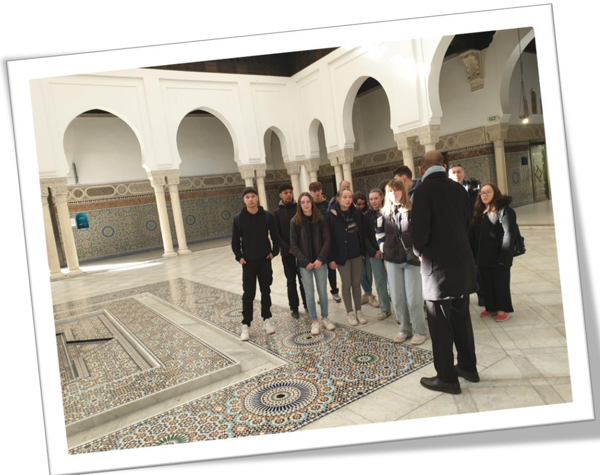
Dans la Grande Mosquée de Paris